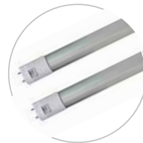
Vista trasera (aluminio)