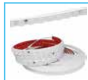
Tira Wallwasher 36w