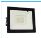
Reflector RGB LED