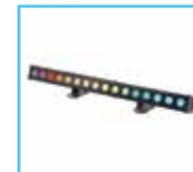
Wall Washer LED RGB